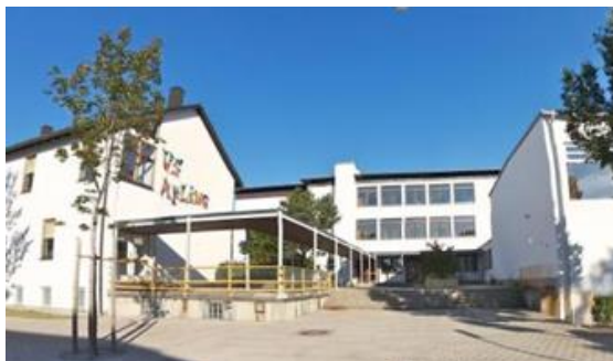
Grund- und Mittelschule Aßling